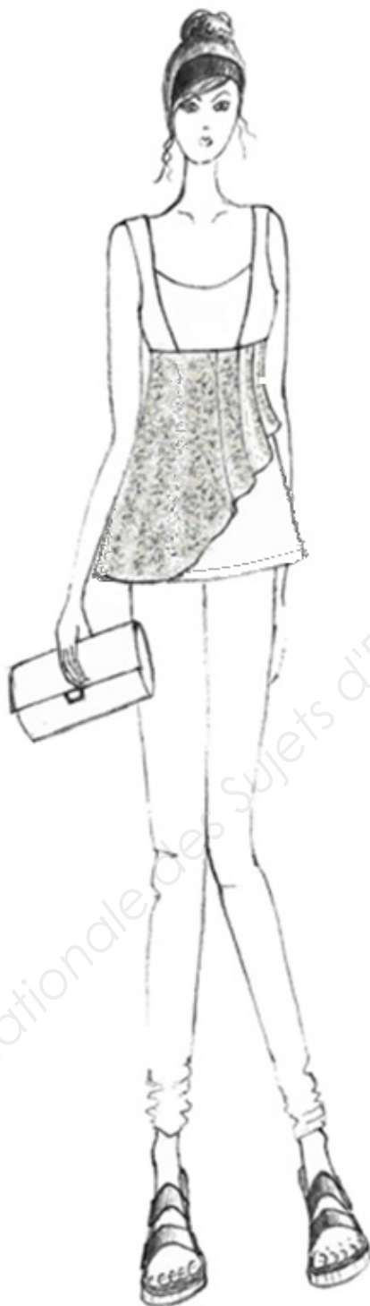
Modèle « DEGAS ».